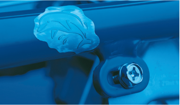
^ Individuelles Kennzeichen am Fahrradrahmen

An Orten, wo Fahrräder nicht auf diese Weise codiert werden, sollten Sie in jedem Fall ein eigenes individuelles Kennzeichen anbringen. Wie unser Beispiel zeigt, empfehlen sich dazu etwa „unvergessliche“ Daten wie das eigene Kfz-Kennzeichen, das eigene Geburtsdatum und die Initialen des eigenen Namens.